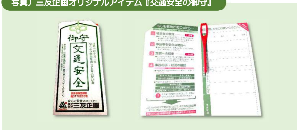
写真）三友企画オリジナルアイテム『交通安全の御守』

「交通安全の御守」（実用新案 第 3176263 号）は、事故に遭われた際に少しでも落ち着いていただき、事故状況の記録や夜間の事故連絡がスムーズに行われるよう考案された弊社オリジナルツールでご好評いただいています。自動車保険のご契約車両に携帯していただくことを推進しています。