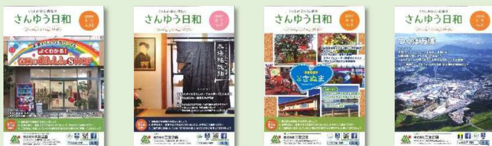
写真)「さんゆう日和」の表紙

くらしの安心と安全や健康に関する情報をお客さまにお伝えすることに併せて、三友企画のことを、より知っていただくことを目的に情報を発信しています。