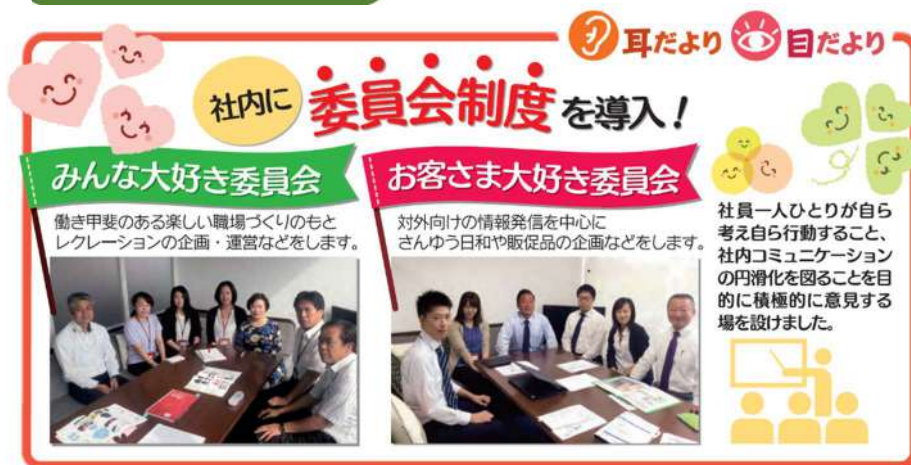
図) 委員会制度の概要