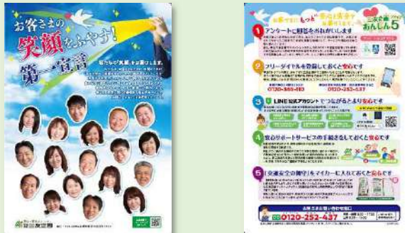
写真)「三友企画あんしん ファイブ 5」サービスチラシ